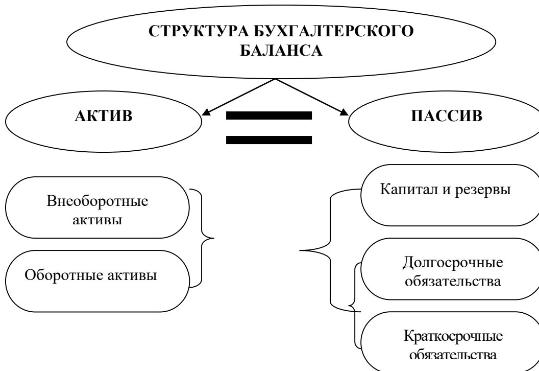
Рис. 1. Структура бухгалтерского баланса