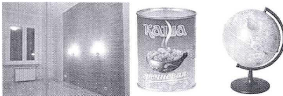
Рисунок 1 - Геометрические фигуры в жизни

Некоторые люди, возможно, считают, что различные линии, фигуры, можно встретить только в книгах ученых математиков. Однако стоит посмотреть вокруг, и мы увидим, что многие предметы имеют форму, похожую на уже знакомые нам геометрические фигуры. Оказывается, их очень много. Просто мы их не всегда замечаем. Мы решили рассказать, какие геометрические фигуры встречаются вокруг нас (рис. 1).