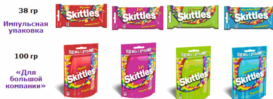
Рис. 2. Портфель жевательных конфет Skittles в России

аналогов на рынке, так как обладают уникальной технологией производства, которую очень сложно повторить. В пачке 5 разных фруктовых вкусов, каждая конфета имеет мягкий центр и твердую глазурь, брендированную буквой «s». Сегодня портфель марки представлен двумя форматами и продается в четырех вкусах (рис. 2):