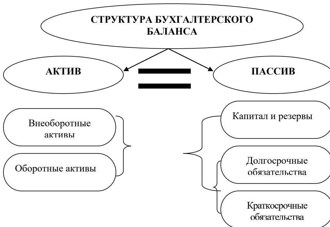
Рис. 1. Структура бухгалтерского баланса