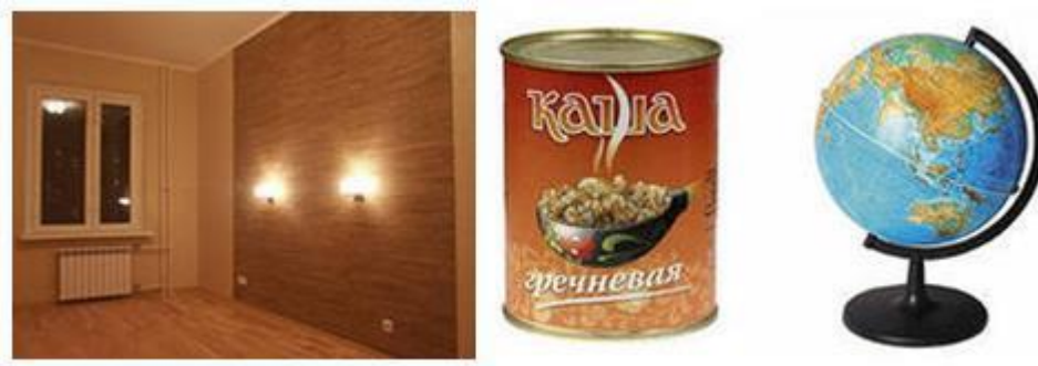
Рисунок 1 – Геометрические фигуры в жизни

Некоторые люди, возможно, считают, что различные линии, фигуры, можно встретить только в книгах ученых математиков. Однако стоит посмотреть вокруг, и мы увидим, что многие предметы имеют форму, похожую на уже знакомые нам геометрические фигуры. Оказывается их очень много. Просто мы их не всегда замечаем. Мы решили рассказать, какие геометрические фигуры встречаются вокруг нас (рис. 1).